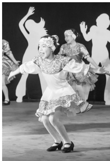
От лица родителей: Ринчинов Б.Б., Цыденова Б.Д.

От лица всех родителей, выражаем огромную благодарность Сурене Баторовне за то, что учит наших детей прекрасному искусству-хореография. Желаем Вам здоровья, терпения, оптимизма!