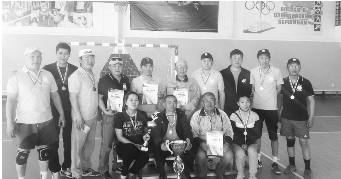
Коллектив РЭС с очередным спортивным достижением

В 2016 году своевременно выполнен план по капитальному ремонту сетей на сумму 10 млн.руб., в срок получен паспорт готовности к осенне-зимнему периоду, что является очень важным моментом как для коллектива, так и для потребителей и района в целом. Проводится большая работа по введению в эксплуатацию новых объектов электросетевого хозяйства района. В настоящее время в Курумканском РЭС эксплуатация и ремонт сетей осуществляется силами Курумканского и Улюханского мастерских участков