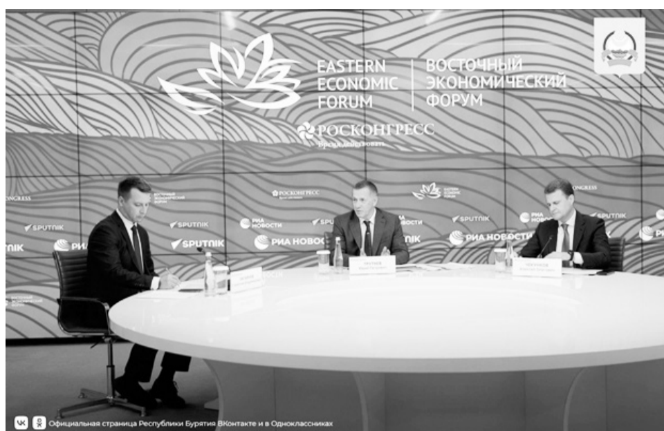
«Россия – АСЕАН», «Россия – Индия», «Россия – Китай», «Россия – Монголия», «Россия – Филиппины».

ВЭФ стал площадкой для переговоров представителей деловых кругов России и стран АТР: развитие сотрудничества и реализацию совместных проектов обсудили участники бизнес-диалогов