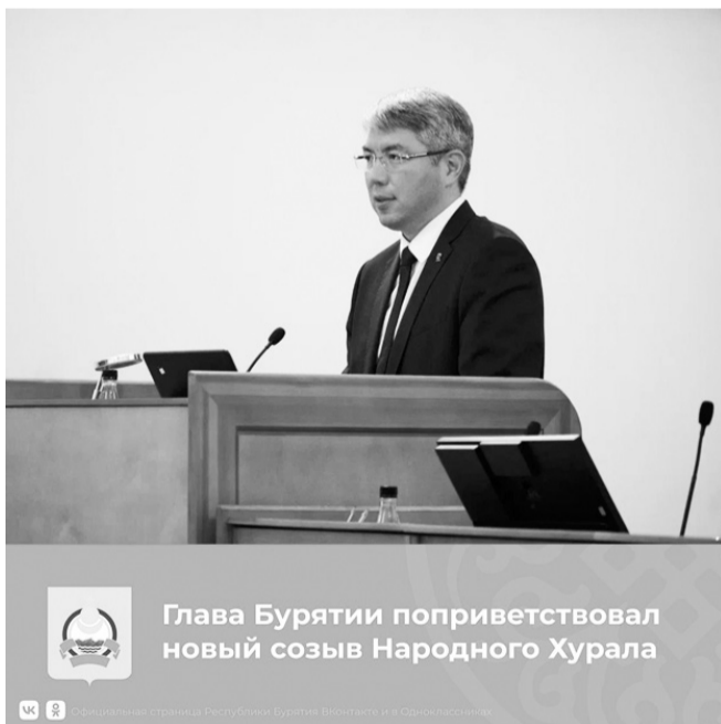
Глава Бурятии поприветствовал новый созыв Народного Хурала

Хурал обновился больше, чем на половину: из 66 депутатов 37 - это обновленный состав. Но все депутаты - люди состоявшиеся, с профессиональным и жизненным опытом. И я уверен, все вы искренне и с полной ответственностью будете работать на благо нашей Бурятии, на благо нашей большой Родины.