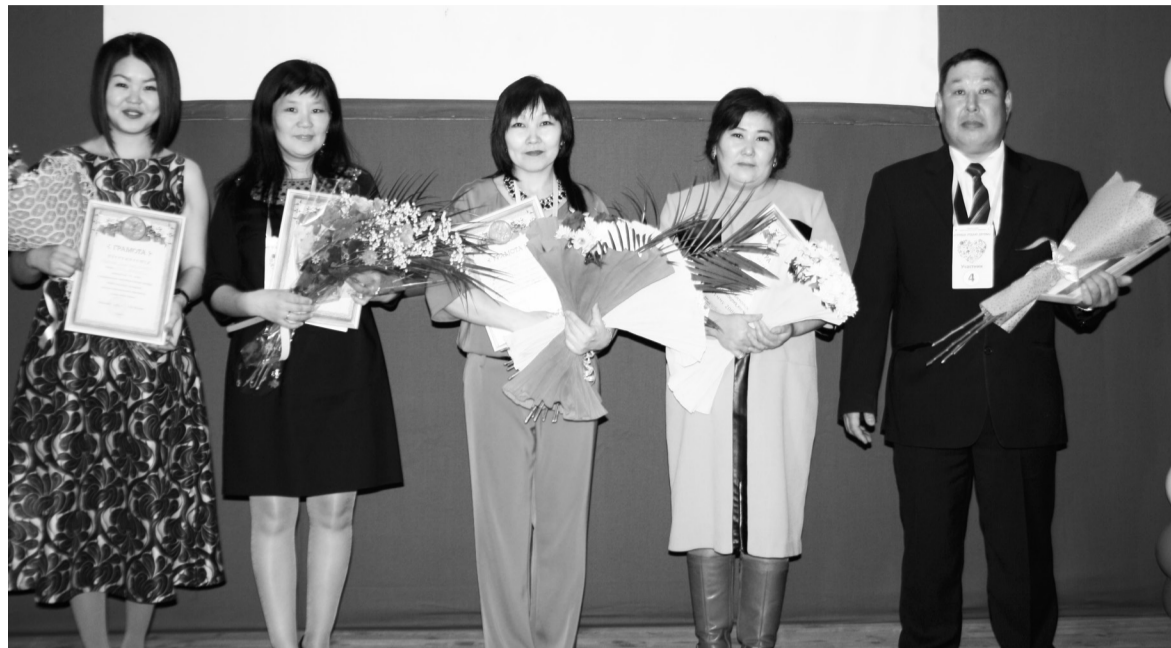
Педагоги дополнительного образования

3 марта 2017 года прошел муниципальный этап Всероссийского конкурса профессионального мастерства педагогов дополнительного образования «Сердце отдаю детям», посвященный Году экологии в России.