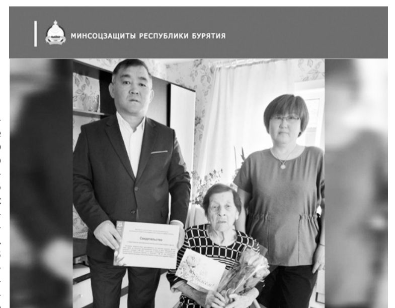
ТРУЖЕНИЦЕ ТЫЛА - 95 ЛЕТ!

- Она награждена медалью «Ветеран труда», многими юбилейными медалями и Почетными