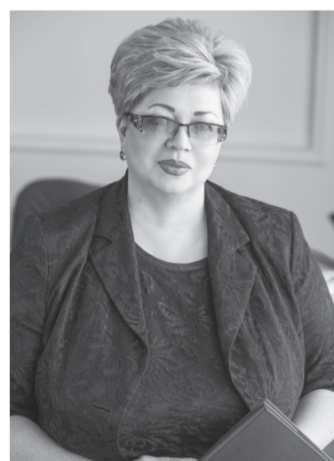
С уважением, Министр социальной защиты населения РБ Т.А. Быкова

Я искренне поздравляю каждого участника V Республиканской спартакиады пенсионеров и желаю новых побед! Ведь участие в этих состязаниях – это уже победа!