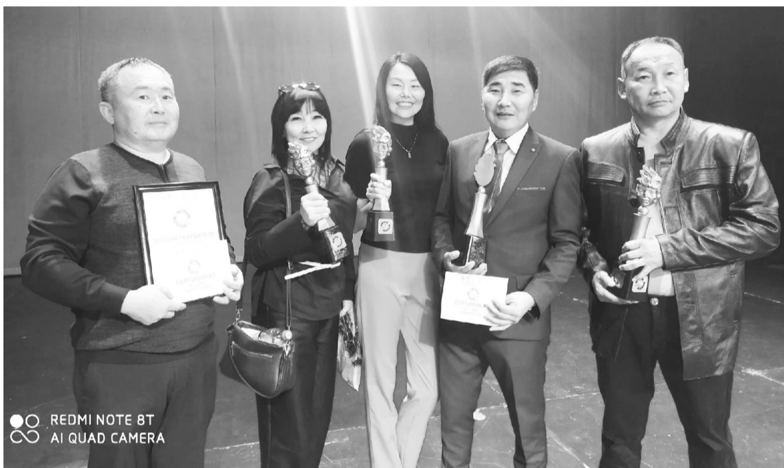
REDMI NOTE 8T AI QUAD CAMERA