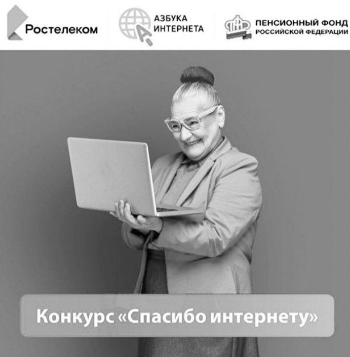
Конкурс «Спасибо интернету»