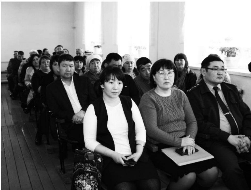
Конференция жителей СП «Могойто»

В поселении проводится большая работа по благоустройству и приведению в порядок санитарного состояния территорий вокруг жилых домов, административных зданий, производственных помещений, магазинов и вдоль улиц. Благодаря поступлению средств на ремонт