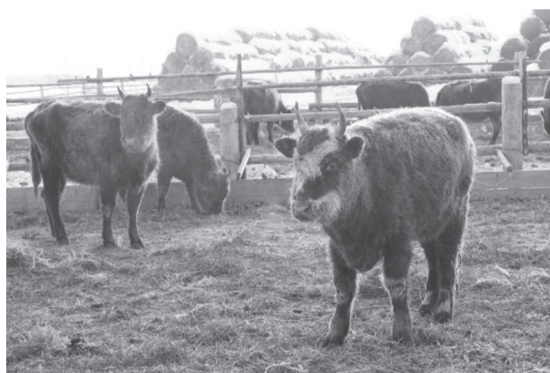
Репродуктивный скот в ООО «Светоч»

По материалам администрации МО «Курумканский район» подготовил Владимир Будаев