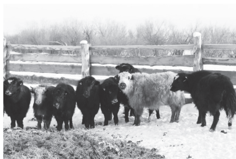
Яки в местности Онхоли