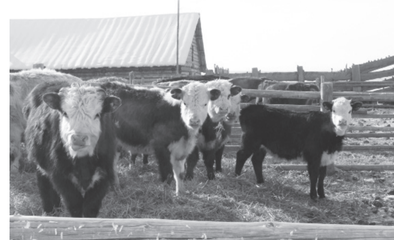
Хозяйство начинающих фермеров