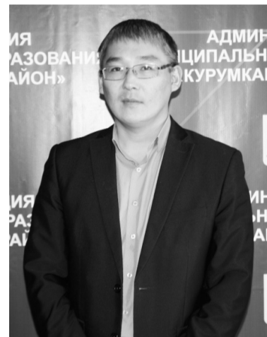
управлению муниципальным имуществом и земельными ресурсами МО «Курумканский район»

Его трудовая деятельность началась в 2012 году в Финансовом управлении администрации МО «Курумканский район» в должности специалиста отдела бухгалтерского учета и отчетности, последовательно был переведен на должность ведущего бухгалтера в централизованную бухгалтерию. С 2014 по 2016 годы работал ведущим специалистом Управления делами администрации МО «Курумканский район», после реорганизации структуры администрации назначен на должность главного специалиста Организационного отдела.