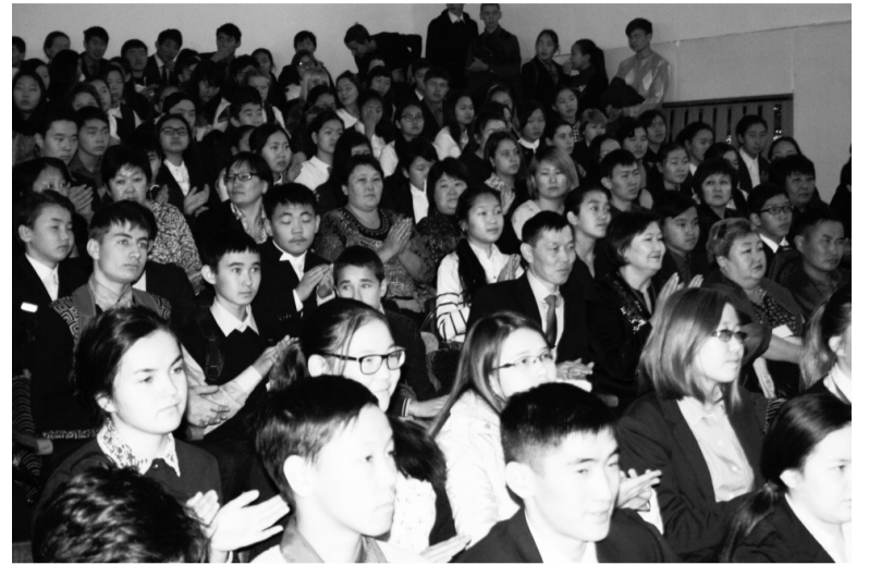
Учащиеся школ района на встрече с представителями БГУ

Также важной частью мероприятия стало подписание договора о сотрудничестве между Бурятским государственным университетом и муниципальным образованием «Курумканский район».