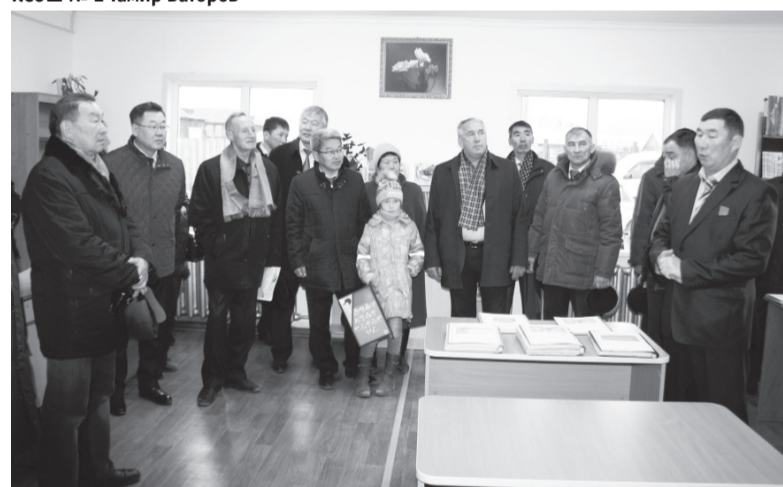
Гости в новом здании детской библиотеки

книги-раскладушки. К услугам посетителей – рабочие места с доступом к электронному каталогу с выходом в Интернет. Доступ к интернет-ресурсам в образовательных целях предоставляется бесплатно.