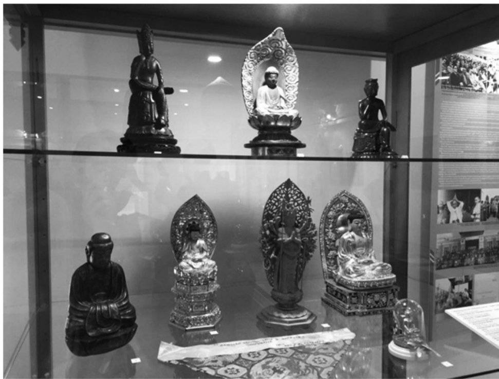
«Хамбын Хүрээ» в контексте развития культуры сотрудников ведущих музеев России (Государственный Эрмитаж, Музей антропологии и

В рамках открытия музея в Буддийском университете «Даши Чойнхорлин» им. Д.Д.Заева прошел круглый стол на тему: «Изучение роли и значения памятников Иволгинского дацана