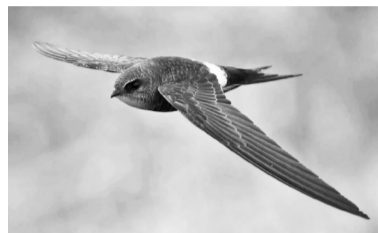
Морин хараасгай (стриж)

Майн 15-да нүхэрни намда хэлээ: «Харнууш, тэнгэрьдэ хараасгайнуудли шубууд ниидчайна» гэжэ. Би тиимэ шубууша ханнам, хараасгайдляад, башай ехэнүүд, харабтар, зүүндля хүүлтэйнууд, сагаан бэхтэйнууд. Ниидчехадаа, эшхэраандля шанга абяа гаргагшан. «Морин хараасгайнууд» гэгшэ бэлэйг («стрижи» – мангадаар)?