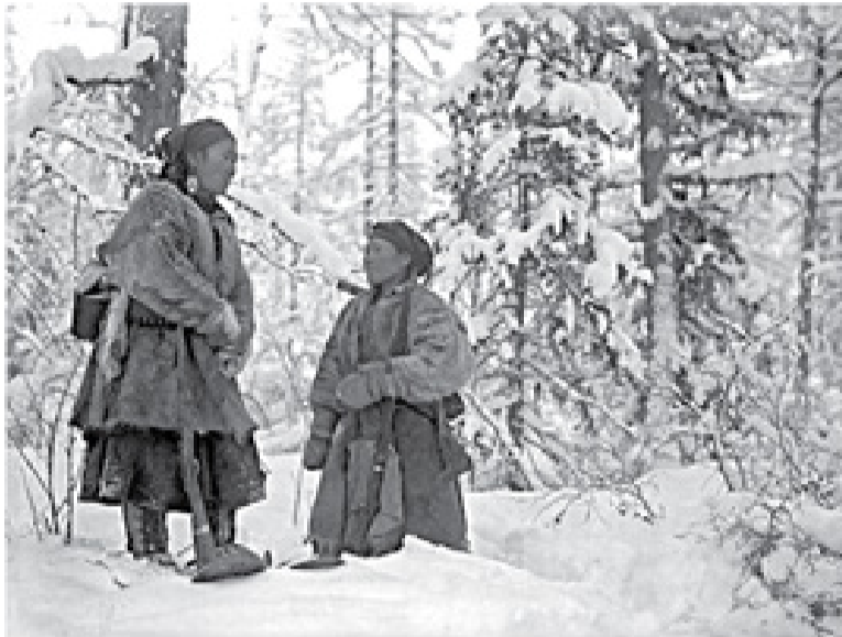
«Женщины-охотники на привале в лесу». Эвенки. 1939 г. Автор И.И. Балуев.

Һониргхот, тезд хамнаган изинүүд агнахадаа эрнүүдтээ орходоо холо шадмарнууд байха. Бээ зад баряад ябдаг, шэрхэ, гам, эн-тэриймэй ажагалхадаа юрдөө бэрхэнүүд, - тэрэ баабайгаан үгтаан интуици гэшэнь хаашаа арьлихим? Тэдэш нюдөөр ээжбайха хайн байгаанаа түлөө боро хараандаш хуу юумэй оноожо харха; баһа орьдоо саанаан үгэгдэн ушар