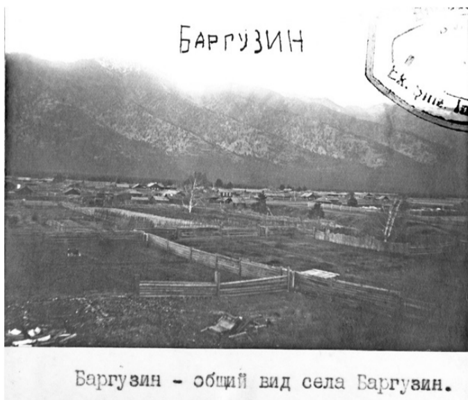
Баргузин – общий вид села Баргузин.