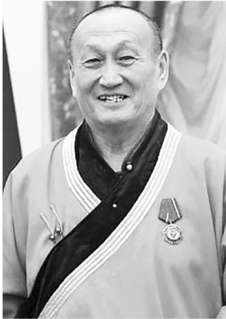
СКРИНШОТ С ВИДЕО.

Очень важно принять участие в выборах. Почему важно? Потому что наша страна стоит перед выбором и этот выбор нужно сделать. Поэтому приглашаю вас прийти и отдать свой голос. Тем самым мы покажем, что мы едины, самостоятельны и добровольно отдаем свои голоса ради будущего России!