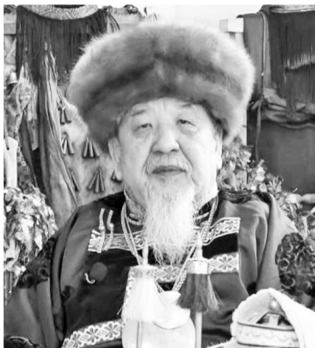
СКРИНШОТ С ВИДЕО.

— Сейчас наша страна, общественность переживает переломный момент, когда вокруг нас идет большая негативная энергия. Нас связывает многое — история, традиции, культура предков, которую нам передали наши отцы и деды. У нас огромная история и мы все это пережили. Сегодня пришел момент истины, чтобы мы все это передали нашим внукам, правнукам, своему потомству. Сегодня у нас выборы президента России. Сегодня я обращаюсь к вам, дорогие земляки. Обращаюсь с тем словом, чтобы мы все сплотились и пошли на выборы. Я думаю что мы достойно вы-