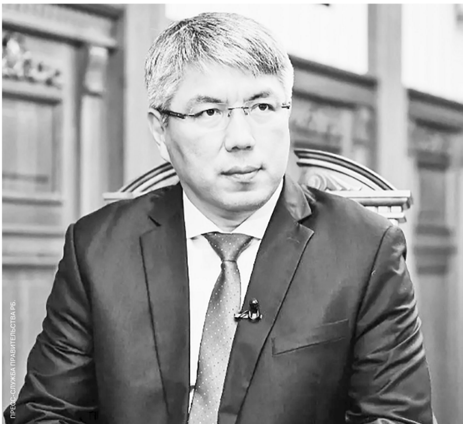
ПРЕСС-СЛУЖБА ПРАВИТЕЛЬСТВА РБ.

Уже 15 марта начнется голосование на выборах президента России. Каждый из нас получил исторический шанс определить дальнейший путь нашей страны. Именно мы – граждане Российской Федерации – несем ответственность за то, какой будет наша Родина. Отказаться от голосования – значит помочь врагам, которые не оставляют попыток развалить нашу страну.