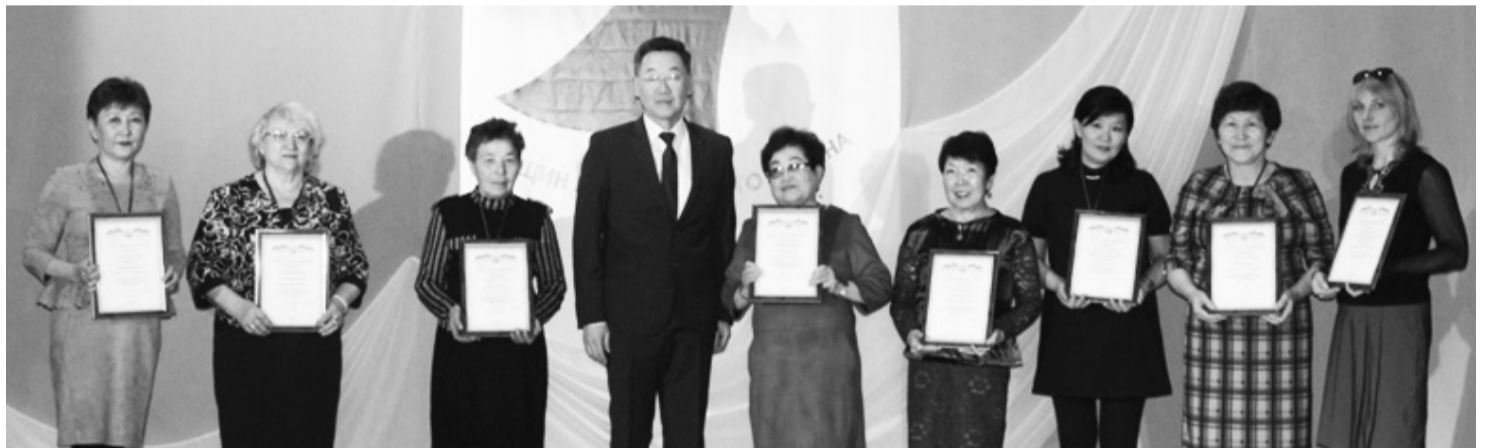
Вручение правительственных наград

- Продолжить совместную работу общественных организаций, совета женщин, организаций, учреждений района.