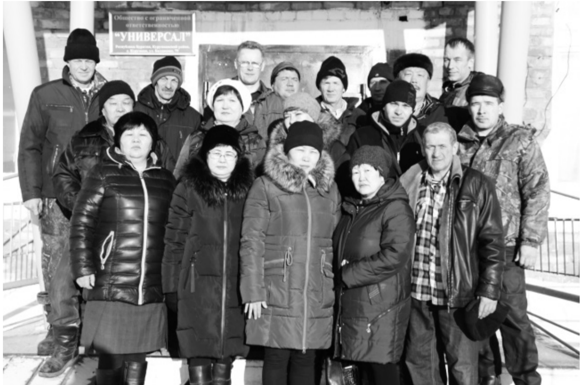
Коллектив ООО «Универсал»

Кроме основной своей деятельности, ООО «Универсал» занимается строительством, монтажом различной сложности. Нами построены такие объекты, как пожарные резервуары на 100 куб. м. в тубсанатории, детских садах «Малышок» и «Росинка», 200 куб.м. в гостинице «Иликчин». Реконструированы наружные канали-