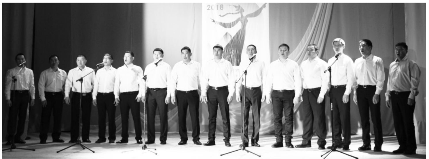
Сборная мужская вокальная группа

-Продолжить проведение в образовательных учреждениях тематические мероприятия по повышению статуса семьи, формированию семейных ценностей, роль воспитания детей.