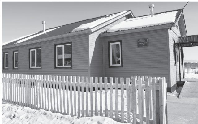
Новое здание ФАП в селе Сахули