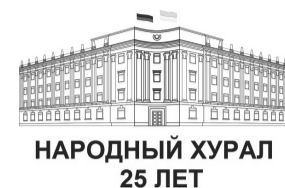
НАРОДНЫЙ ХУРАЛ 25 ЛЕТ

Депутаты Народного Хурала Бурятии собрались на первой в этом году сессии. В повестку было включено свыше 50 вопросов, парламентарии приняли 32 закона, пять из которых в первом чтении. Одобрены поправки в бюджет на 2019 год, в двух чтениях принята стратегия развития республики до 2035 года. Кроме этого на сессии произошло сразу несколько кадровых назначений. О принятых на сессии решениях, подробно в материале Восток-Телеинформ.