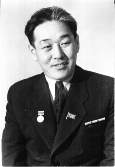
Народный артист СССР Гомбо Цыдынжапов

В конце 1930-х годов наша республика начала готовиться к I Декаде бурятского искусства и литературы в Москве. Подготовка стала делом чести всех творческих и общественных организаций.