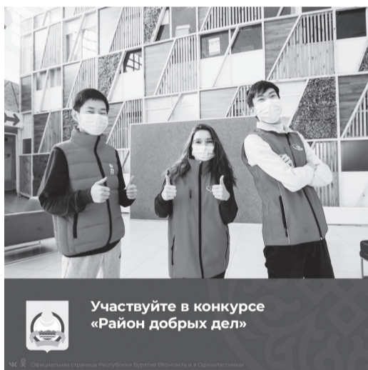
Участвуйте в конкурсе «Район добрых дел»