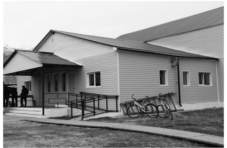
Обновлённое здание спортивного зала в селе Барагхан