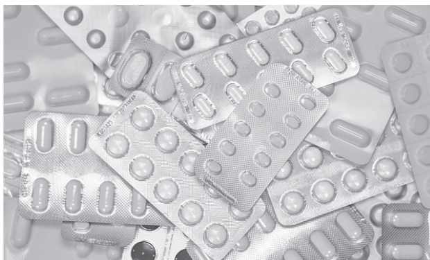
Маркировка лекарственных препаратов вводится поэтапно.

С внедрением мониторинга движения лекарственных препаратов у покупателей появится возможность проверить лекарственный препарат на предмет качества с помощью мобильного приложения «Проверка маркировки товаров» путём считывания штрих кода.