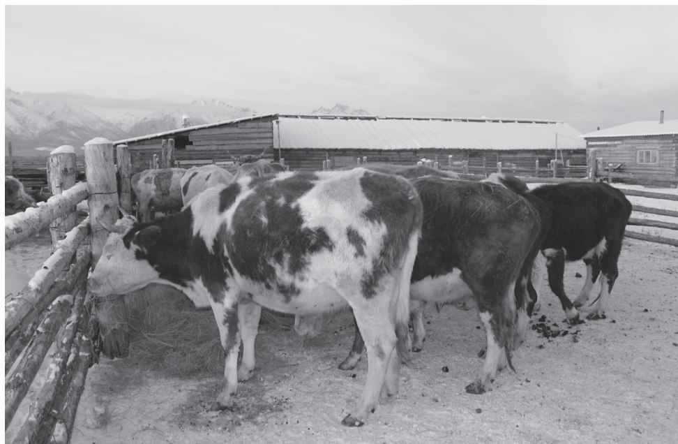
Идёт зимний стойловый период

Сено в ООО «Светоч» есть, несмотря на морозы упитанность хорошая, поэтому надеются сохранить всё поголовье. Единственная проблема, как и везде, волки, которые в зимнее время не дают покоя животноводам. Так и получается, что летом мучают травы, а зимой волки. Но в этот день мы