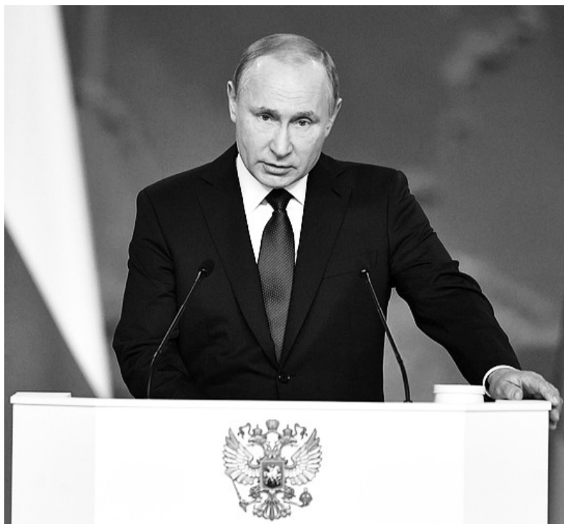
Послание Президента Федеральному Собранию.

Президент в послании предложил также увеличить и федеральную льготу по налогу на недвижимое имущество для многодетных семей. В частности, предполагается дополнительно освободить от налога по 5 кв. метров в квартире и по 7 кв. метров в доме на каждого ребёнка. Полностью от налога будут освобождены 6 соток из