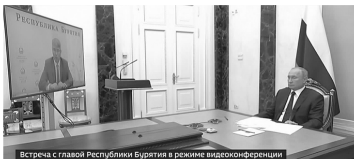
Встреча с главой Республики Бурятия в режиме видеоконференции