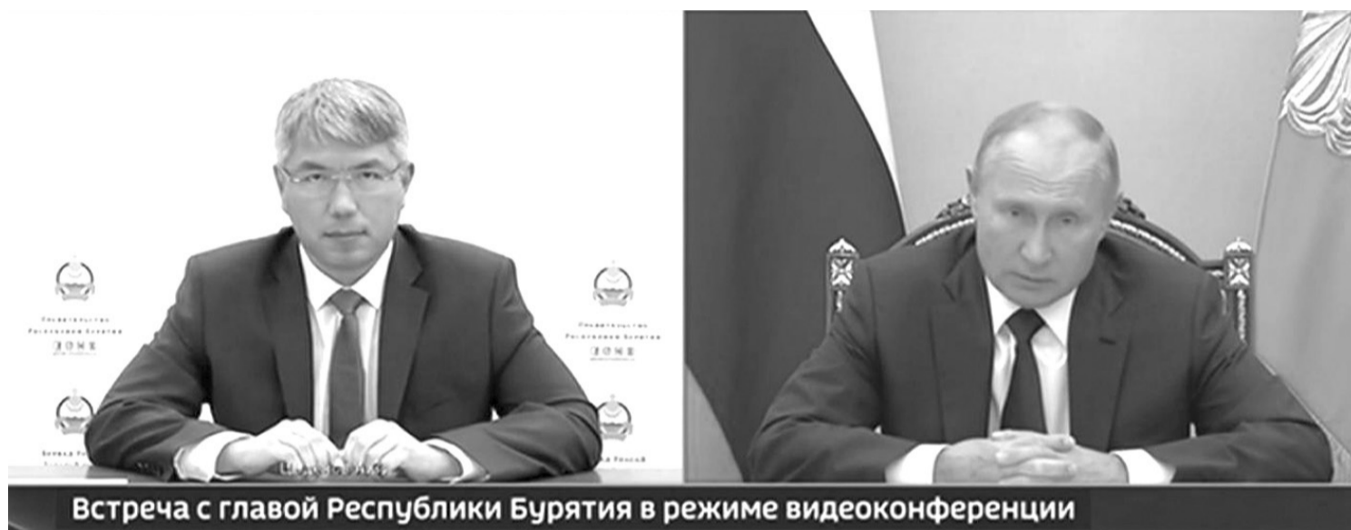
Встреча с главой Республики Бурятия в режиме видеоконференции

Владимир Путин встретился с главой Бурятии Алексеем Цыденовым в режиме видеоконференции. Президент страны хвалил Бурятию, давал наказы, с просьбами главы Бурятии согласился и назвал их важными. Алексею Цыденову встреча удалась, что не всегда случается с региональными лидерами на встречах с президентом.