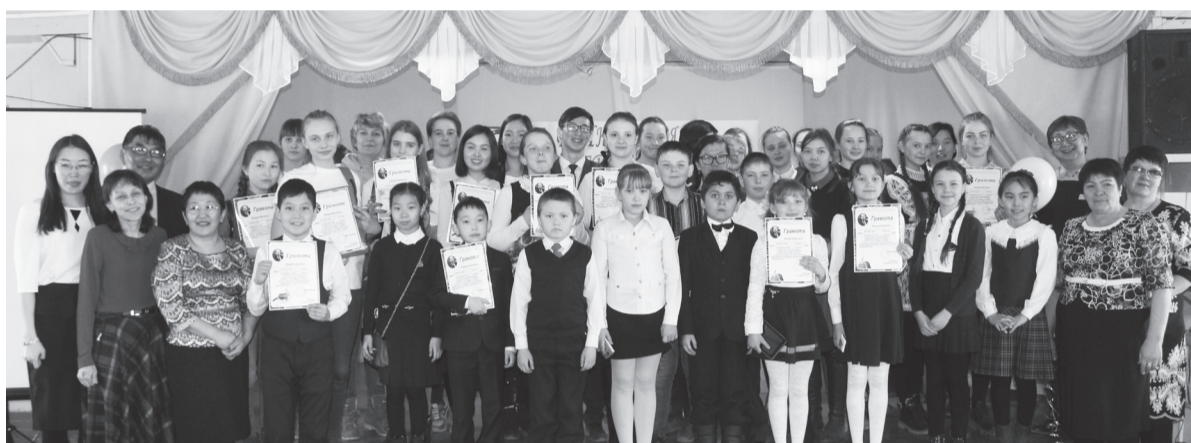
Участники конкурса после церемонии награждения

классный классный», о высоком призвании профессии учителя.